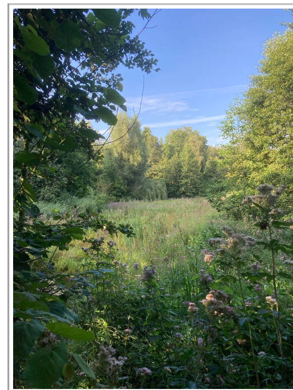
Unser Biotop

Für mehr Umwelt- und Naturschutz vor der eigenen Haustür!